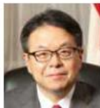
世耕 弘成 経済産業大臣 兼 内閣府特命担当大臣 参議院議員