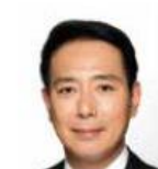
前原 誠司 衆議院議員