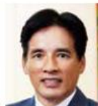
堀 義人 グロービス経営大学院 学長 グロービス・キャピタル・パートナーズ 代表パートナー