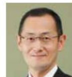
山中 伸弥 京都大学 教授 iPS細胞研究所 所長