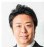
高島 宗一郎 福岡市長