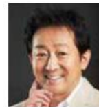
辰巳 琢郎 俳優