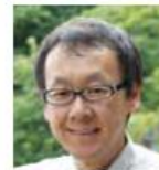
星野 佳路 星野リゾート 代表