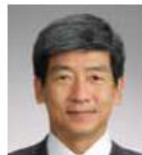
田口 義隆 セイノーホールディングス株式会社 代表取締役社長